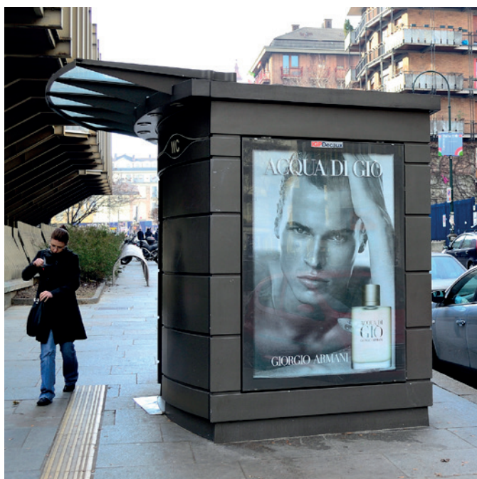
Turin, Italie, Design Philip Cox