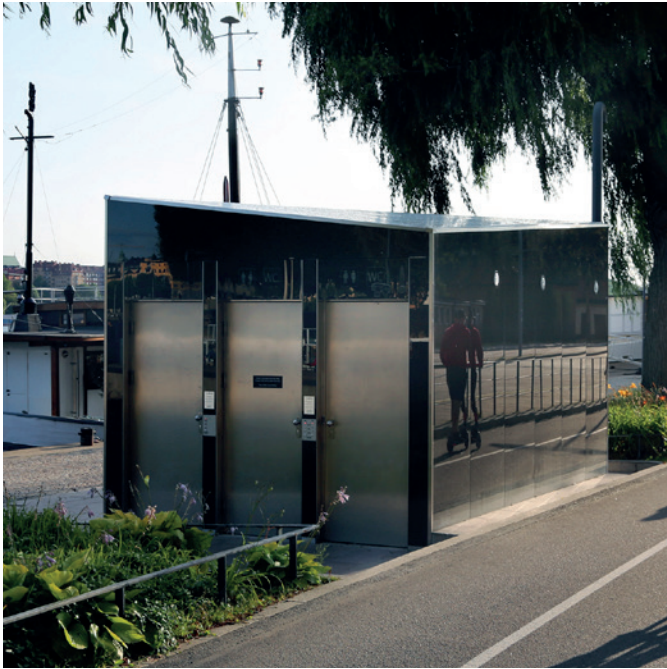
Stockholm, Suède, Design Wall / JCDecaux