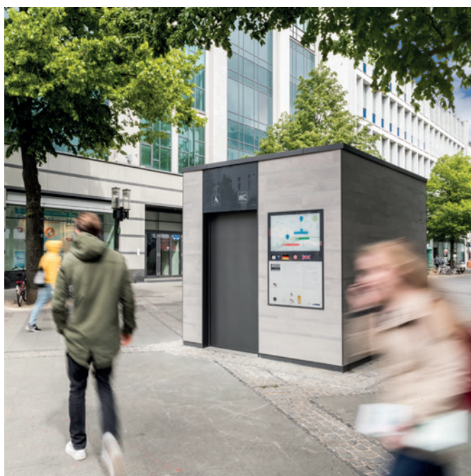
Berlin, Allemagne, Design Wall / JCDecaux