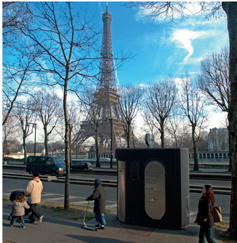
1 er modèle de sanitaire automatique - Design JCDecaux - Paris - 1981

Jusqu'au début des années 1980, les toilettes publiques sont rares, vétustes, mal entretenues et uniquement réservées aux hommes.