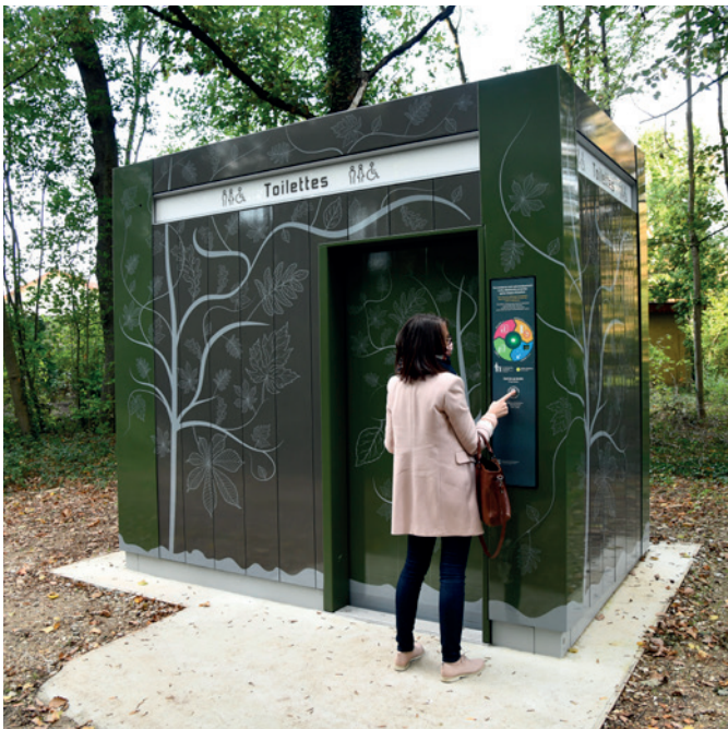
Forêt de Saint-Germain-en-Laye, France, Design JCDecaux