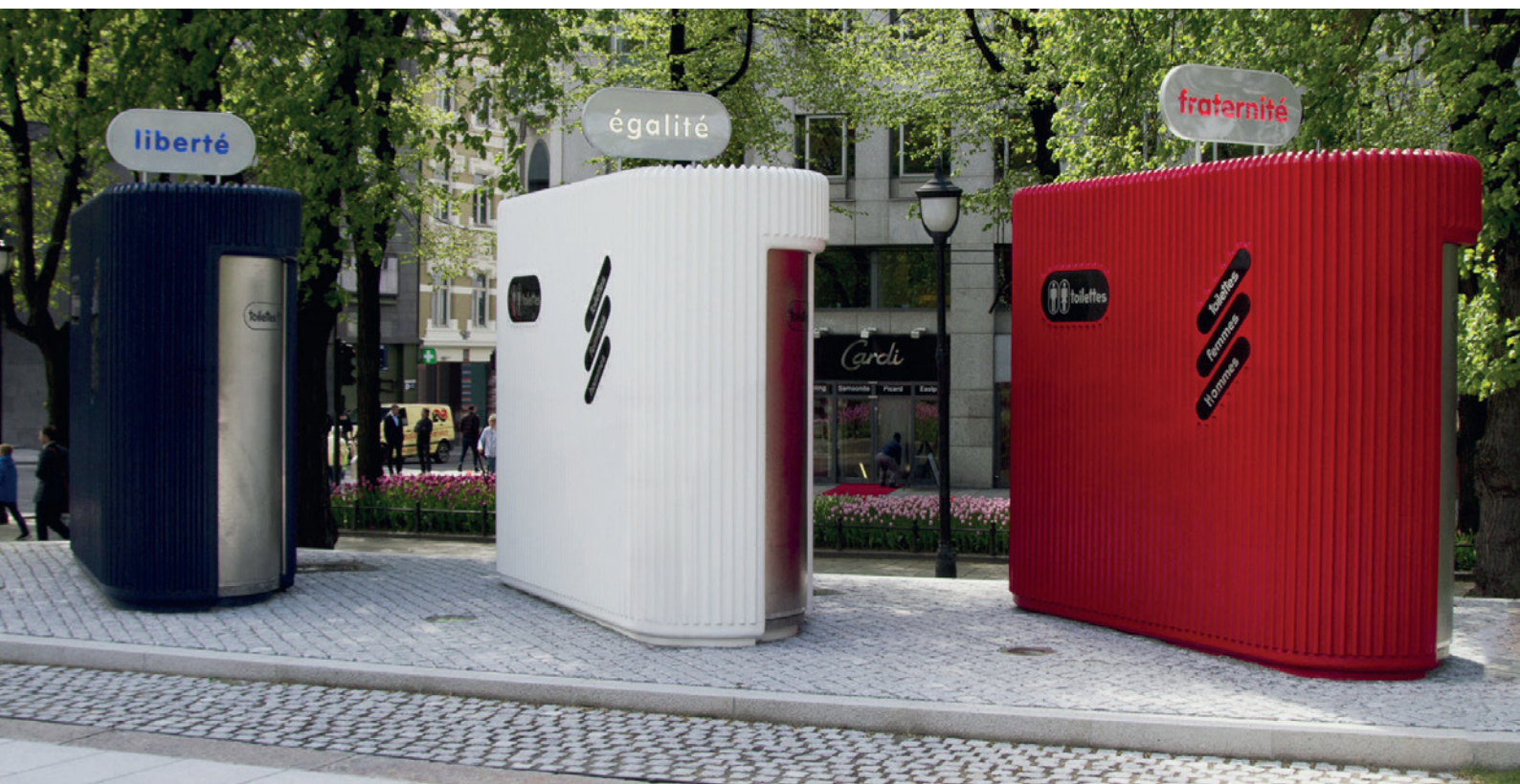
Oslo - Norvège

L'artiste norvégien Lars Ramberg s'est inspiré des premiers sanitaires à entretien automatique installés à Paris, pour célébrer en 2005 le centenaire de l'indépendance de la Norvège, auparavant rattachée à la Suède.