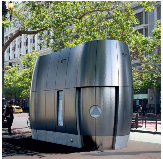
Photomontage - Prochainement à San Francisco, USA, Design SmithGroup