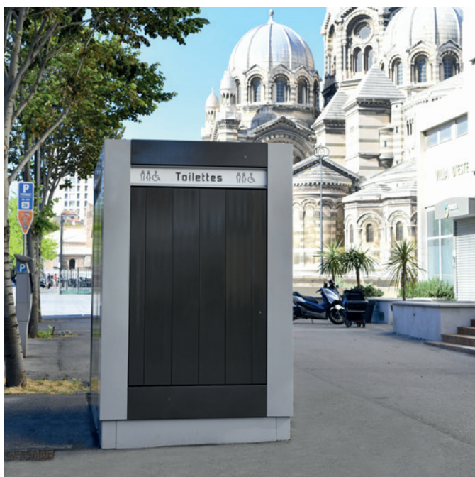
Marseille, France, Design JCDecaux