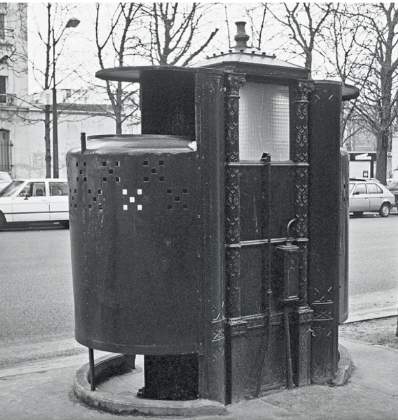
Vespasienne - Paris - XIX ème siècle