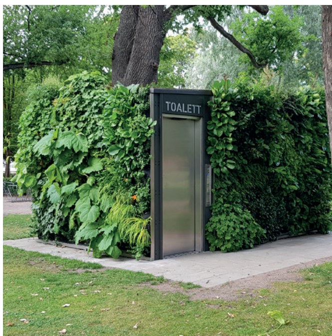
Uppsala, Suède, Design JCDecaux